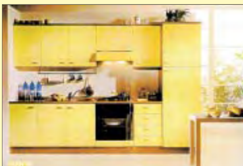
Cucina su misura euro 1.100,00

TUTTO PER IL NATALE decorazioni alberi addobbi regali gadget