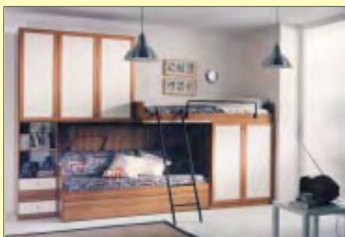
Camera a soppalco euro 450,00