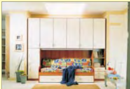
Camera a ponte euro 390,00