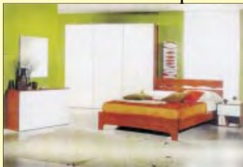
Camera matrimoniale da euro 390 a euro 490