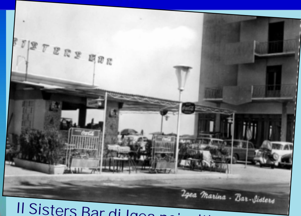
Igea Marina - Bar-Sisters