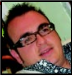
di Cristian Scagnelli

Ci colleghiamo con il "Comunale" di Bellaria per la telecronaca dell'incontro Ficcanaso-Comune. La prima formazione è sensibilmente in vantaggio per cinque reti a zero. Potrebbe essere questa la cronaca di quello che sta accadendo sul campo da gioco della nostra città a proposito dei rottami di auto e motorini sparsi per tutto il territorio. Va detto che, dopo gli articoli pubblicati dal Nuovo , qualcosa è successo e alcune auto sono state rimosse. L'ammiraglia Fiat Croma che da anni era in sosta nel parcheggio vicino alla rotonda di via Properzio è sparita (1-0). Stessa sorte per la Golf rimossa da via Bacci, nella zona Colonie (2-0), dove però sono apparsi sulla spiaggia metri e metri di tubi che, con la stagione alle porte, verranno utilizzati per il ripascimento. E' scomparso pure lo scooter in via Ravenna (3-0), zona Bordonchio, così come l'accoppiata divano-scooter a Igea centro (4-0). Gli altri