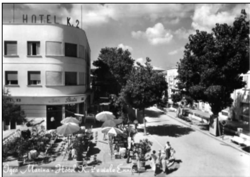
Igea Marina - Hotel K2 e viale Ennio