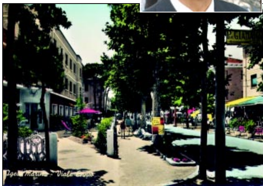
Igea Marina - Viale Ennio

Bici da riparare? Ritiro e consegna sono gratuiti direttamente a casa tua