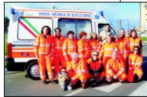
conti presieduti dal dottor Alfonso Vasini."

"Tolti dalle entrate l'importo del mutuo e il contributo ricevuto da Romagna Est, e tolto dalle uscite il valore del nuovo mezzo, si evidenzia un avanzo di gestione per l'anno 2006 di complessivi 14.821 euro, che sommati agli avanzi dei periodi precedenti fanno risultare una liquidità disponibile di 40.638 euro", spiega Grosseto. "Estremamente positivo anche il giudizio sulla gestione contabile, espresso nella loro relazione dai revisori dei