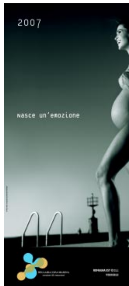
Il poster prodotto da Verdeblù su uno scatto di Maurizio Polverelli. Lo scorso anno l'immagine era stata quella di Silvio Canini.

BELLARIA IGEA MARINA (zona artig. Bellaria Monte) via del Lavoro, 4