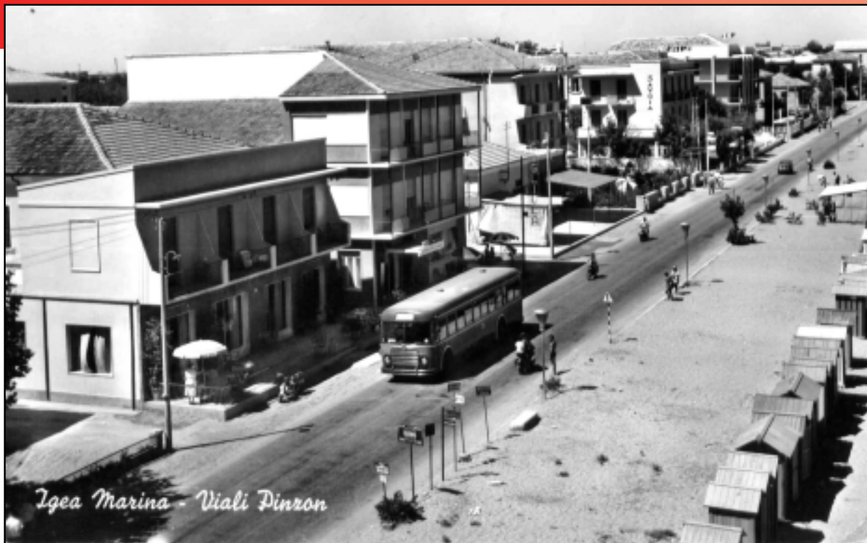
Igea Marina - Viale Pinzon