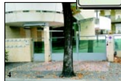
Ecco alcuni parcheggi e passi carrai da guinness.