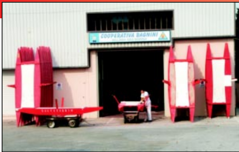
Siamo soliti vederli in posizione orizzontale, sulla battaglia o sull'acqua. Invece i mosconi nella foto sembrano desiderosi di camminare. O forse di spiccare il volo verso il cielo, stile Goldrake: "Si trasforma in un razzo missile con circuiti di mille valvole fra le stelle sprinta e v... Ufo Robot, Ufo Robot".