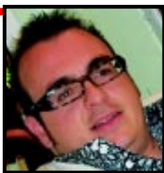
di Cristian Scagnelli