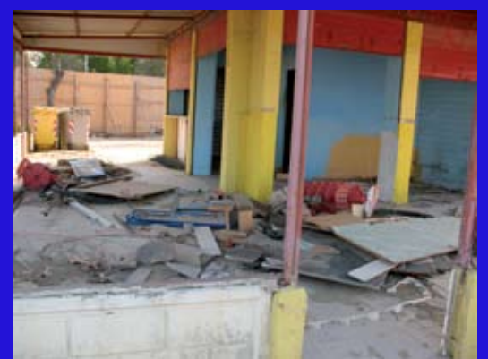
Macerie e degrado.