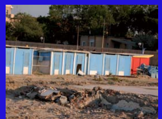
Ed ecco la nuova vista, dal porto. Uno spettacolo!