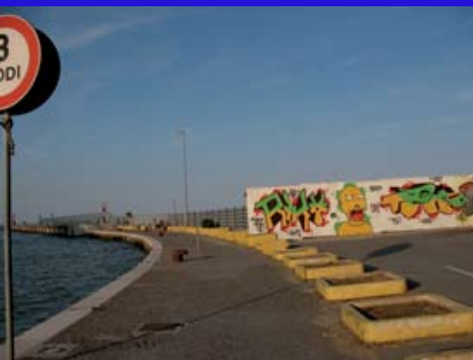
Il colpo d'occhio sul porto: periferia urbana

Al suo posto un cantiere aperto e chiuso. Centinaia di metri quadrati di spiaggia inutilizzabile, che appaiono come segno di deturpazione e di decadenza. Inoltre appaiono i primi segni di quell'erosione, esclusa dagli amministratori con grande veemenza. Sembra di essere in una periferia urbana. Meno male che il mare continua a star lì a ricordarci che non può essere questo il nostro futuro. Una sola domanda. Ma bisognava proprio aprire i cantieri prima della stagione?