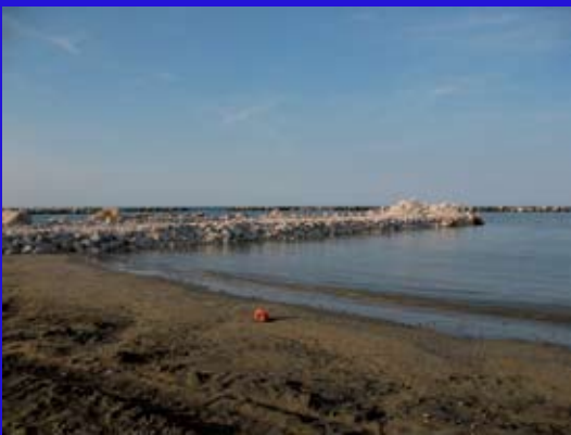
Questo è il pennello che ha creato i primi fenomeni di erosione