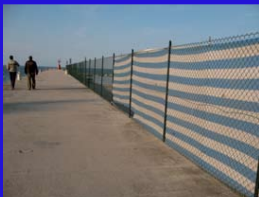
La nuova passeggiata sul porto. Pardon! Sul cantiere!