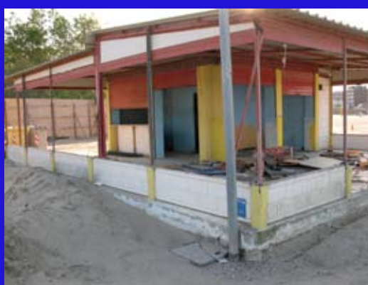
Questi edifici abbandonati (bar e cabine) chi accoglieranno questa estate? E' lecito essere assai preoccupati.